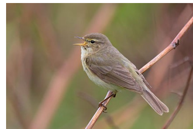
Un pouillot véloce

Voici quelques oiseaux que tu pourrais bien entendre en Région Liégeoise : les merles, corneilles, pigeons, mésanges charbonnières, pouillots véloce, pics verts... sans oublier les oiseaux migrateurs comme les oies qui sont occupées à rentrer de leur migration.